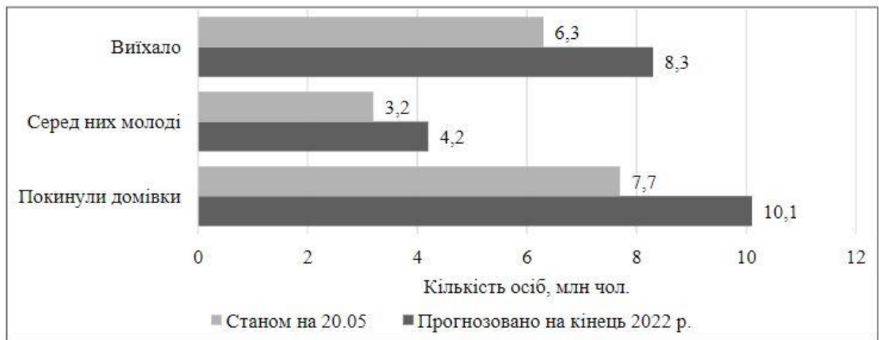
Рис. 2.1. Динаміка показників повернення української молоді в Україну

Станом на 20 травня з України виїхало 6,3 млн. українців (близько половини з яких – люди до 30 років), що відображає рис. 2.1 [71].