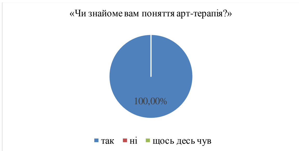
Рис. 1 Результати опитування відповідей на запитання 1

На питання 1 «Чи знайоме вам поняття арт-терапія?», ми отримали наступні відповіді: – так – 17, що становить 100%; ні – 0, що становить 0%; щось десь чув – 0, що становить 0% (Рис. 1).