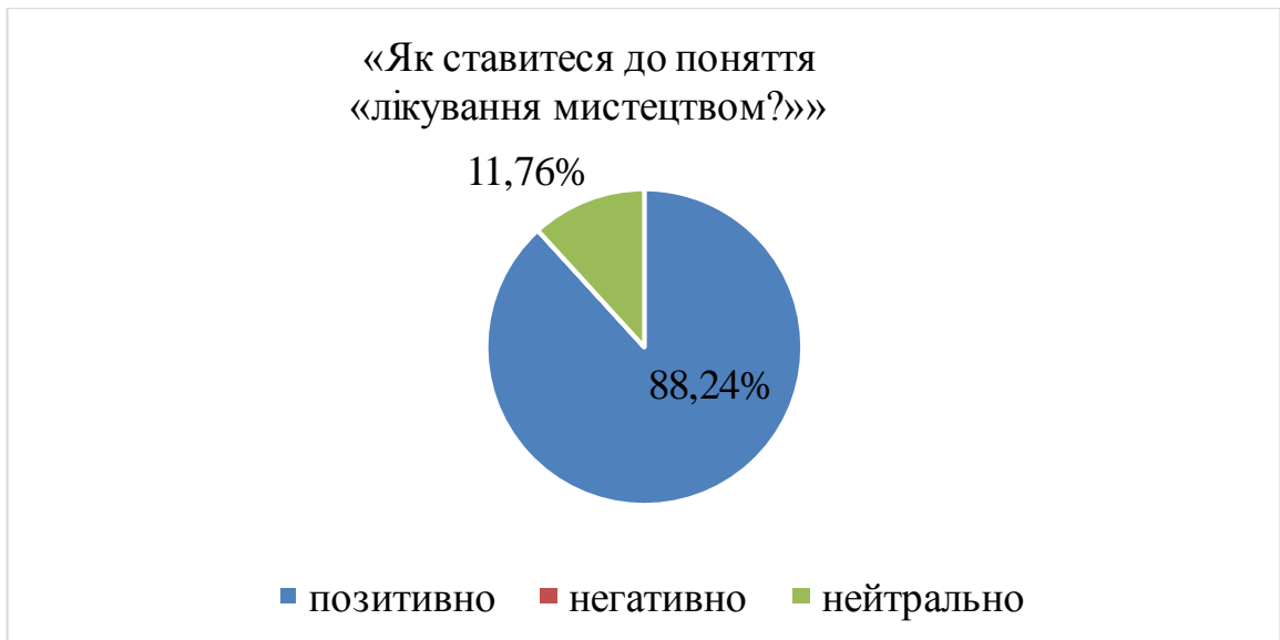
Рис. 2 Результати опитування відповідей на запитання 3

На питання 4 та 5 «Які заходи з використання арт-терапії ви знаєте?» та «Які заходи з використання арт-терапії ви б хотіли відвідати», учасники відповідали в довільній формі, як правило писали, що хочуть повторно відвідати тренінги з арт-терапії та літературний вечір.