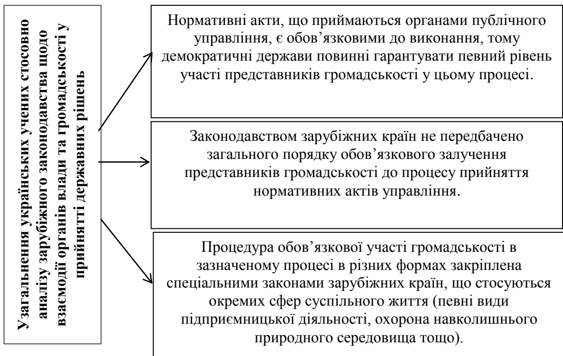
Рисунок 1. узагальнення українських учених стосовно аналізу зарубіжного законодавства у сфері взаємодії органів влади та громадськості у прийнятті державних рішень.

На Рисунку 1 визначено узагальнення українських учених стосовно аналізу зарубіжного законодавства у сфері взаємодії органів влади та громадськості у прийнятті державних рішень.