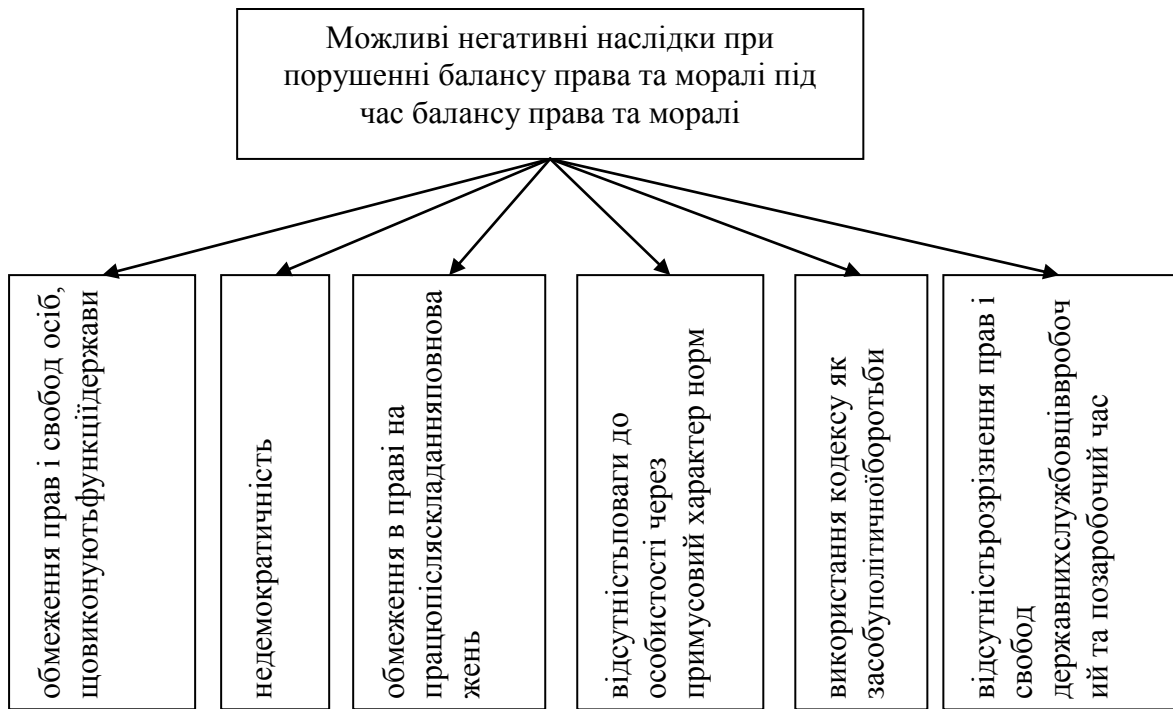
Рис. 3. Можливі негативні наслідки при порушенні балансу права та моралі під час балансу права та моралі