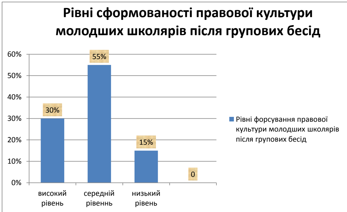
Рис. 3.2. Діаграма рівнів сформованості правової культури молодших школярів за результатами другого зрізу.

Зведення та порівняння даних щодо стану сформованості правової культури молодших школярів дозволило нам зобразити на діаграмі динаміку її зміни до початку проведення експериментальної роботи та після її завершення. Рис. 3.3.