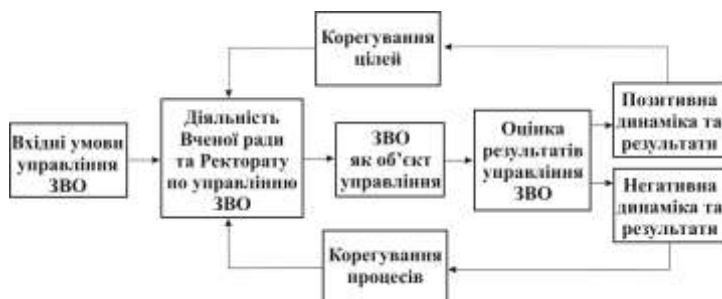
Рисунок 3 – Структурна схема закладу вищої освіти як об'єкту управління з урахуванням позитивної та негативної динаміки оцінки результатів управління.

Принциповий підхід до формалізації управлінської діяльності багаторівневої моделі управління ЗВО передбачає значну роль деталізації різних напрямів діяльності закладу освіти за ключовими показниками. Відповідно до даного підходу забезпечується наступність адміністративних рішень на стратегічному рівні управління.