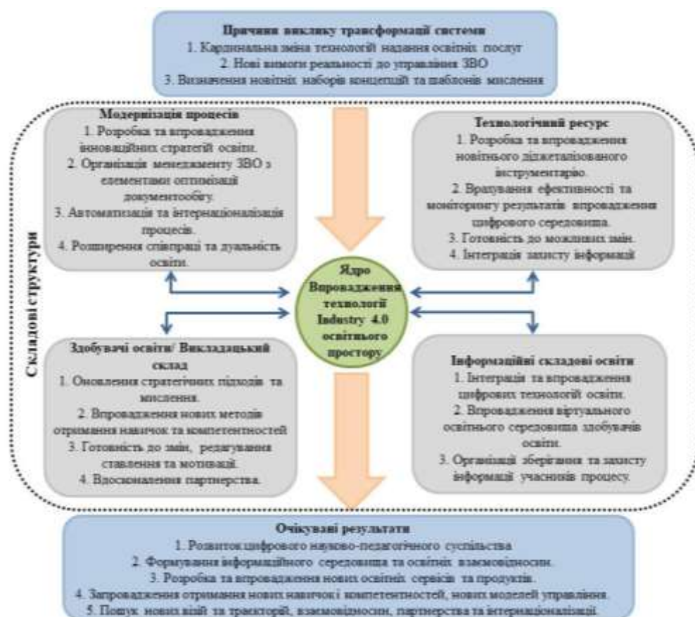
Рисунок 1 - Структурна схема трансформації системи управління ЗВО з урахуванням впровадження Industry 4.0

У другому розділі «Правові засади публічного адміністрування у сфері освіти» кваліфікаційної роботи досліджено актуальне законодавче регулювання сучасної вищої освіти та питання кластеризації, як інструменту публічного управління освітою. За результатами проведеного аналізу була сформована структурна схема трансформації системи управління ЗВО з урахуванням впровадження Industry 4.0 приведена на рис. 1.