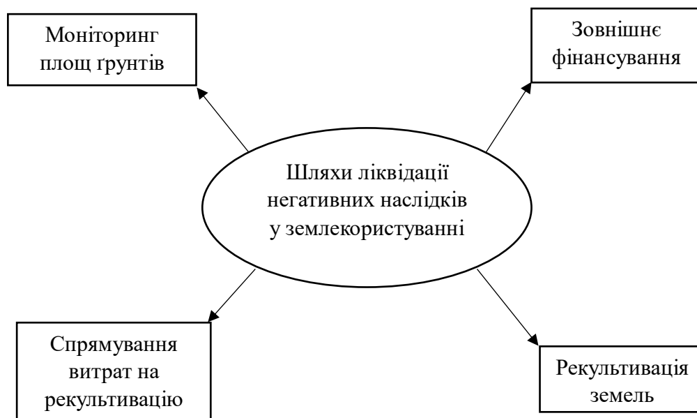
Рис.1.2. Шляхи ліквідації негативних наслідків у землекористуванні.

Для подолання негативних наслідків у землекористуванні, спричинених сьогоdnішніми подіями, слід відновлювати втрачений потенціал, що сприятиме поступовому відродженню територій та забезпеченню прогресу, досягнутого Україною на європейському шляху розвитку. Нами окреслено такі шляхи ліквідації негативних наслідків (рис.1.2).