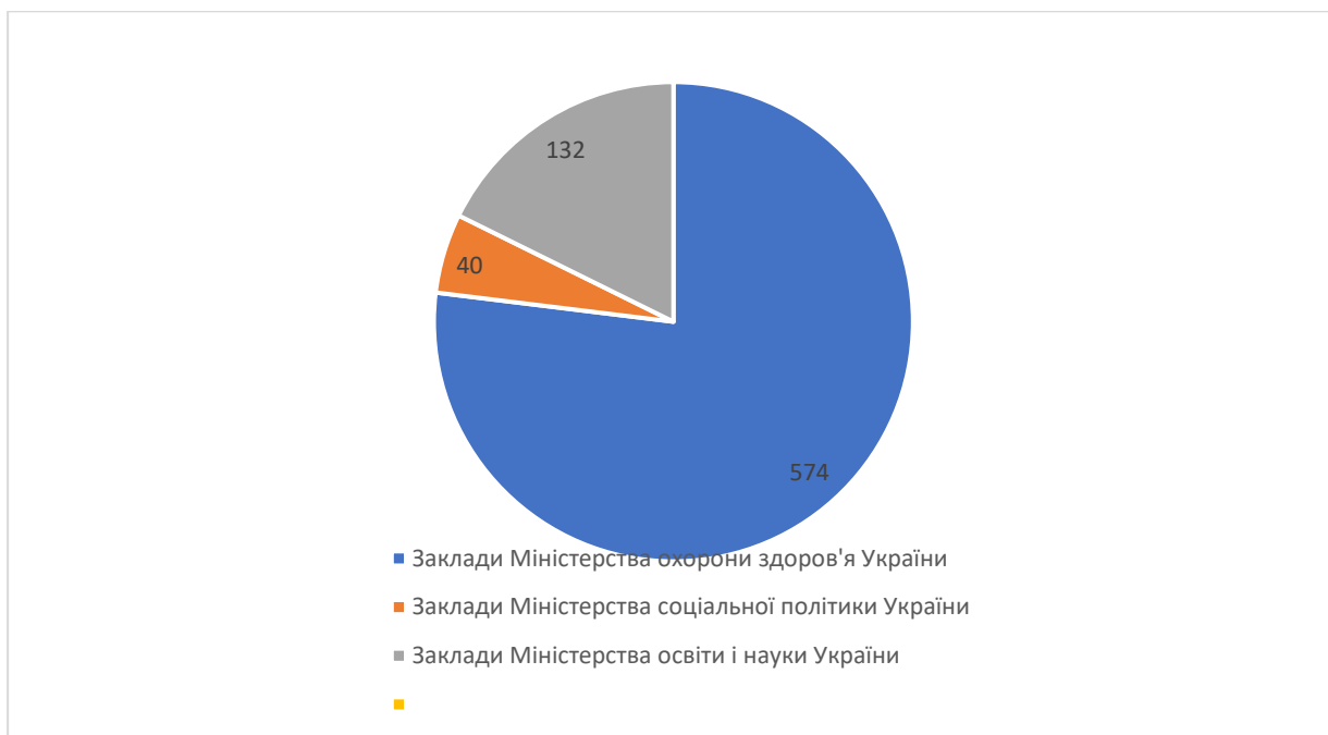
Рисунок 2.1 - Система підпорядкування інституційних закладів догляду та виховання дітей в Україні

направляють дітей з проблемами здоров'я, посиротілих дітей, дітей, які перебувають у СЖО. У будинках дитини забезпечують як паліативне, так і соціальне обслуговування.