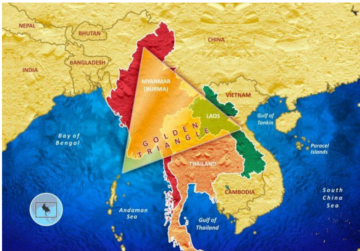
Карта «золотого трикутника»

Джерело: Lintner B. Guide to Investigating Organized Crime in the Golden Triangle – Introduction // Global Investigative Journal: official page. 2022. November 22. URL: https://gijn.org/2022/11/28/guide-to-investigating-organized-crime-in-the-golden-triangle-introduction/