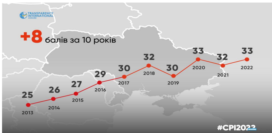
Рис 3.1. Динаміка індексу корупції в Україні за 2013-2022 роки [14]

Аналіз законодавства України у сфері протидії корупції свідчить, що незважаючи на значну кількість законів та підзаконних актів, вони на практиці часто були неефективними та майже не виконувались. Тому протягом багатьох років темпи подолання корупції в Україні були вкрай повільними.