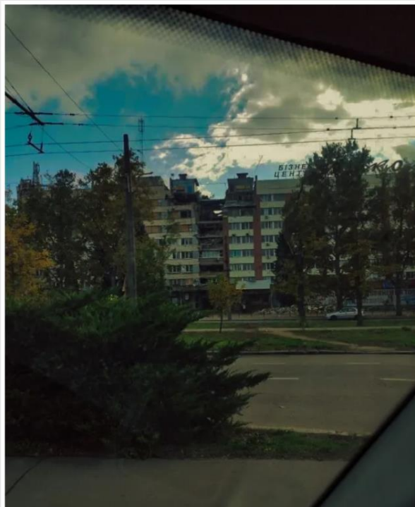
Фото наслідку обстрілів Бізнес центру. Зроблене 10.11.2022

До останнього моменту не хотілося вірити, що все це відбувається насправді. Замість будинка прокидаєшся від повітряної тривоги та прильотів. Бомбосховища та підвали для багатьох стали новим тимчасовим домом.