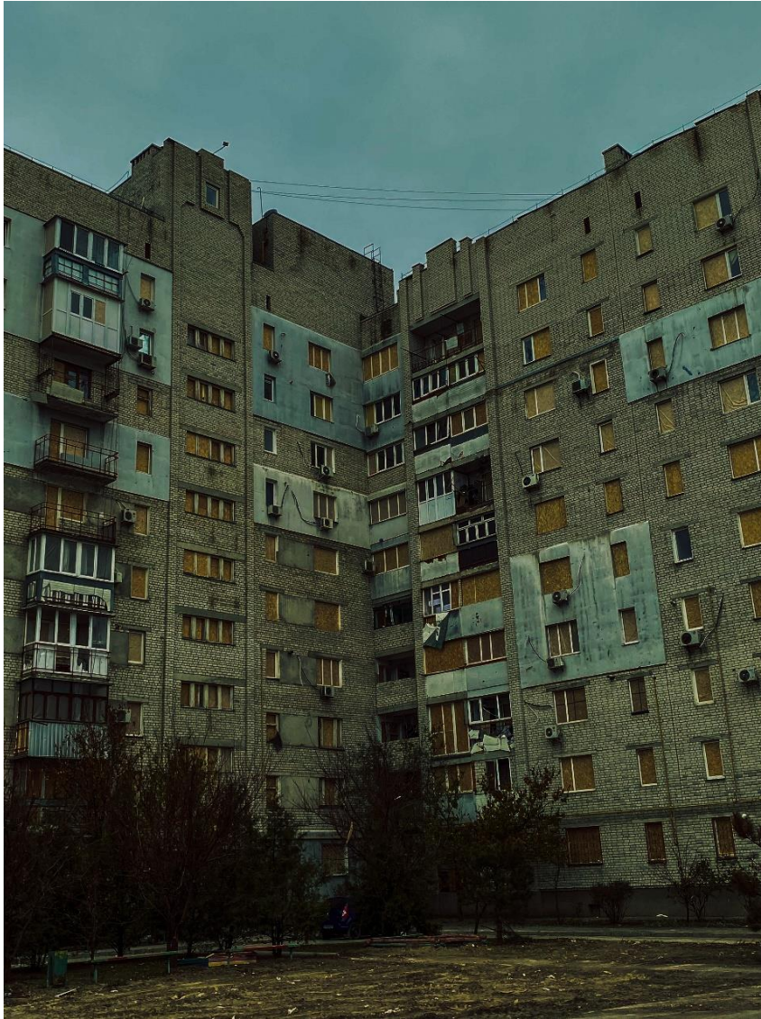
Богоявленський район. Фото зроблене 11.11.2022

Вікна та двері магазинів, будинків і багатоповерхівок заклеювали фанерою після пошкоджень, щоб почувати себе захищеними, а також це допомагало зробити домівки теплішими в холодні дні.