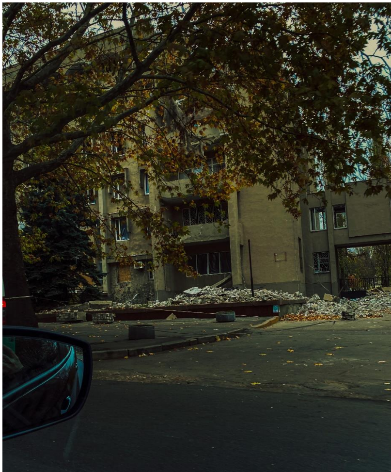
15.07.2022 Університет ім. Сухомлинського. Фото зроблене 11.11.2022