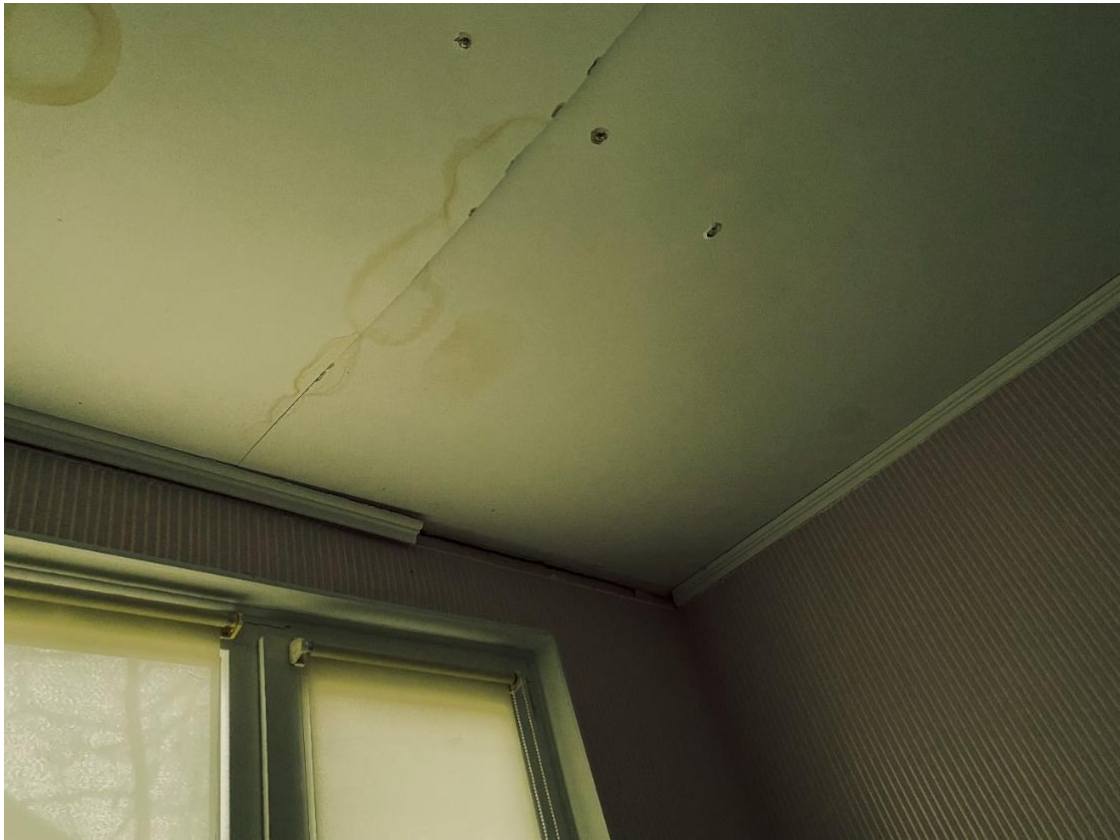
Квартира бабусі автора. Фото зроблене 11.08.2022

Автор відобразив особливості життя людей під час воєнного стану в одній з публікацій на сайті Чорноморського національного університету імені Петра Могили.