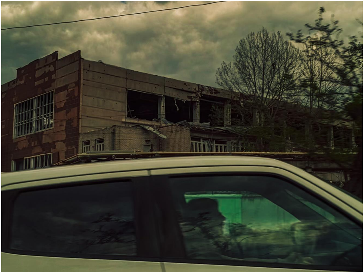
16.05.2023 Завод «Зоря - Машпроект». Фото зроблене 17.05.2023

Повномасштабне вторгнення вплинуло на закриття багатьох магазинів, університетів, шкіл, дитячих садів та багато іншого. Обстрілів зазнали Миколаївські університети, а саме Миколаївський національний університет імені Сухомлинського, Національний університет кораблебудування ім. Макарова та Чорноморський національний університет імені Петра Могили.