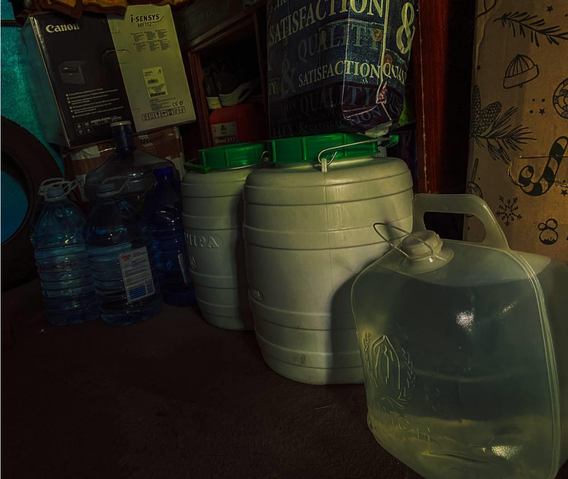
Фото зроблене 17.06.2023

Миколаївці більшість часу знаходяться без чистої води, яка має обмежені можливості у використанні, тому жителі міста набирають воду у криницях. Цей фактор створює величезні проблеми для мешканців, впливаючи на їхнє здоров'я та повсякденне життя.