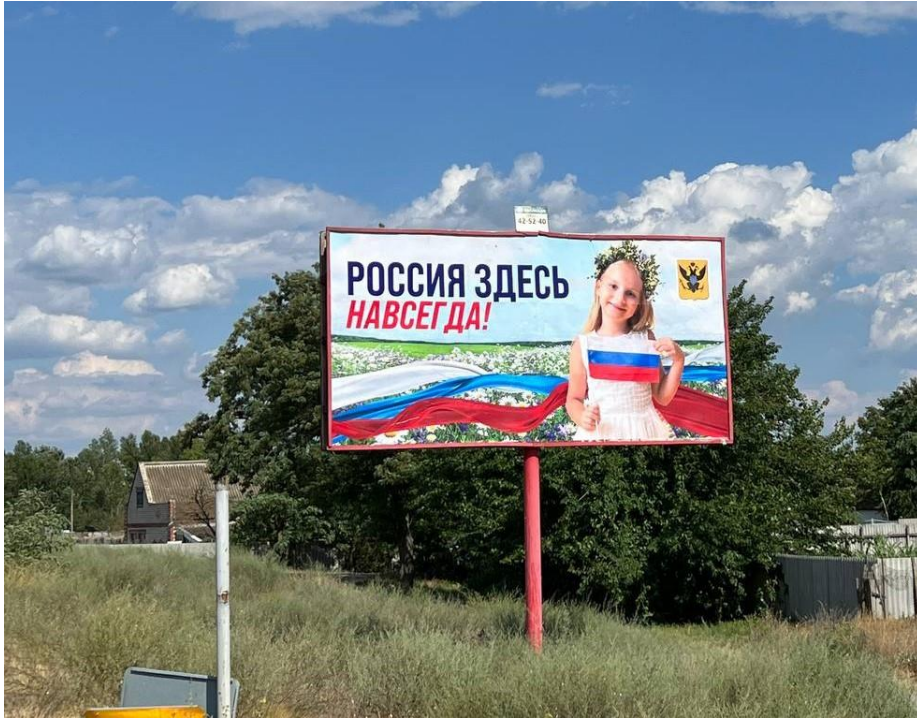
(ДОДАТОК 1) [17]