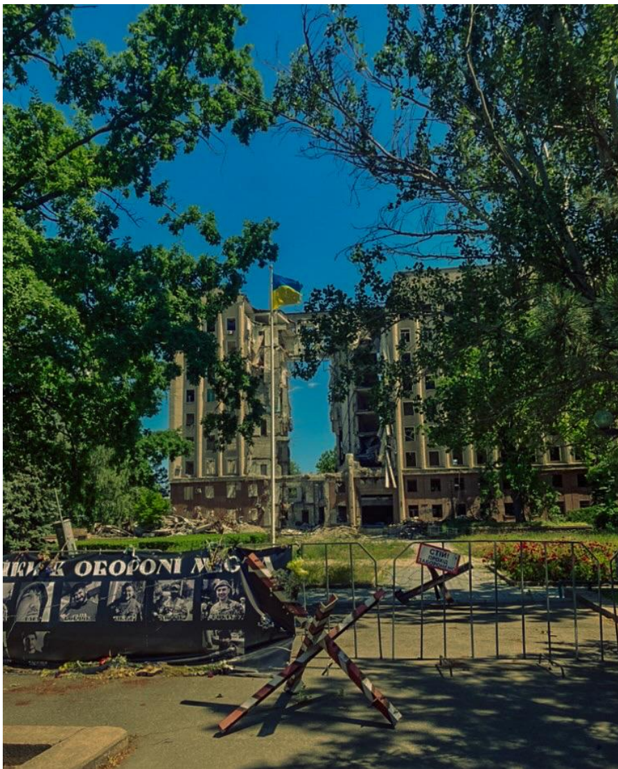
29.03.2022 Миколаївська ОДА. Фото зроблене 16.05.2023

Згодом Віталій Кім повідомив про 33 загиблих.