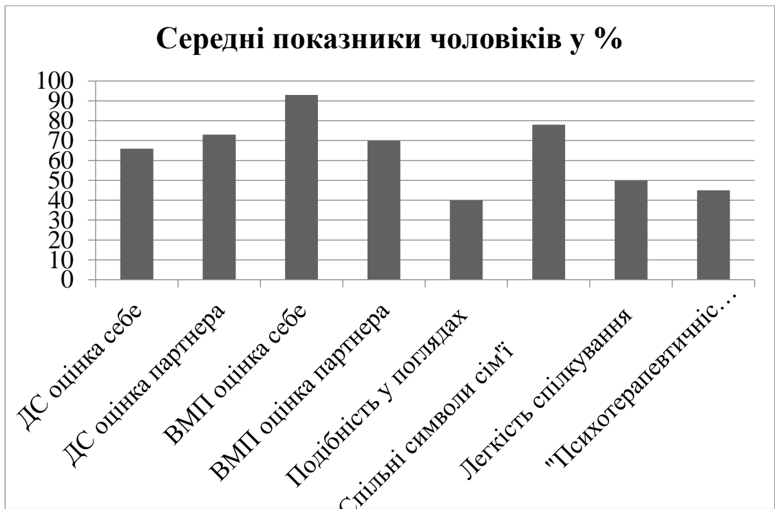
Рис. 2.2. Середні результати діагностованої групи чоловіків за опитуванням особливості спілкування між подружжям

За діаграмою ми бачимо, що низький показник (0% – 20%) та понижений показник (21% – 40%) відсутні за жодною шкалою. Це означає, що спілкування муж подружжям відбувається в цілому на середньому та високому рівні (з точки зору чоловіка).