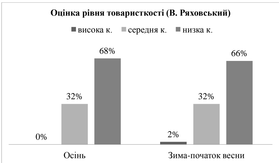
Рис. 2.1. Результати діагностованої групи молоді за тестом на визначення рівня товарищкості

З рисунку 2.1 можна побачити, що восени у кількості опитуваних студентів-молоді (у кількості 40 осіб) не виявлено високого рівню комунікабельності, а у повторному зрізі – лише 2%, тобто 1 у однієї особи виявлено високий рівень. Кореляційні зв'язки між цими факторами впливу, ми опишемо в пункті 2.3. Середній рівень комунікативності серед вибірки, як восени, так і в зимку-навесні виявили 32% – це 13 осіб набрали бали від 9 до 24, що свідчить про нормальний рівень комунікативних здібностей. Низький рівень за шкалою комунікативності (це від 25 до 32 балів) восени набрали 68% усієї вибірки (це аж 27 осіб), а взимку-навесні – 66% (26 осіб).