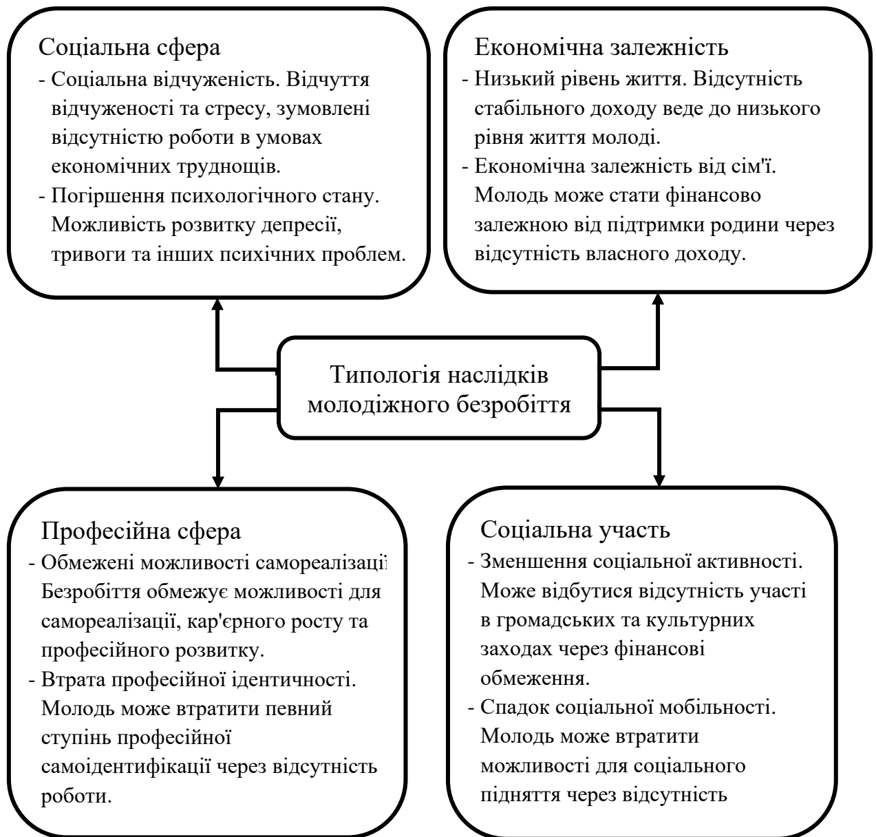
Рис. 2.3. Типологія наслідків молодіжного безробіття [Офіційні звіти та публікації Міжнародної організації праці]

Аналіз молодіжного безробіття в Україні включає в себе вивчення широкого спектру факторів, які визначають та впливають на це явище. Розглянемо деякі ключові аспекти цього питання більш детально.