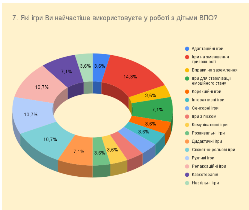
Рис. 2.3. Результати опитування респондентів на питання «Які ігри Ви найчастіше використовуєте у роботі з дітьми ВПО?»

найбільш популярних видів ігор, що використовуються фахівцями та було створено діаграму найбільш розповсюджених відповідей на поставлене питання (Рис. 2.3.). Найбільше спеціалісти соціальної сфери застосовують адаптаційні ігри (14,3%), інтерактивні, сенсорні та ігри з піском (по 10,7% відповідно). Менш популярними, але досить цікавими виявились такі ігрові технології: казкотерапія, корекційні ігри та ігри для стабілізації емоційного стану.