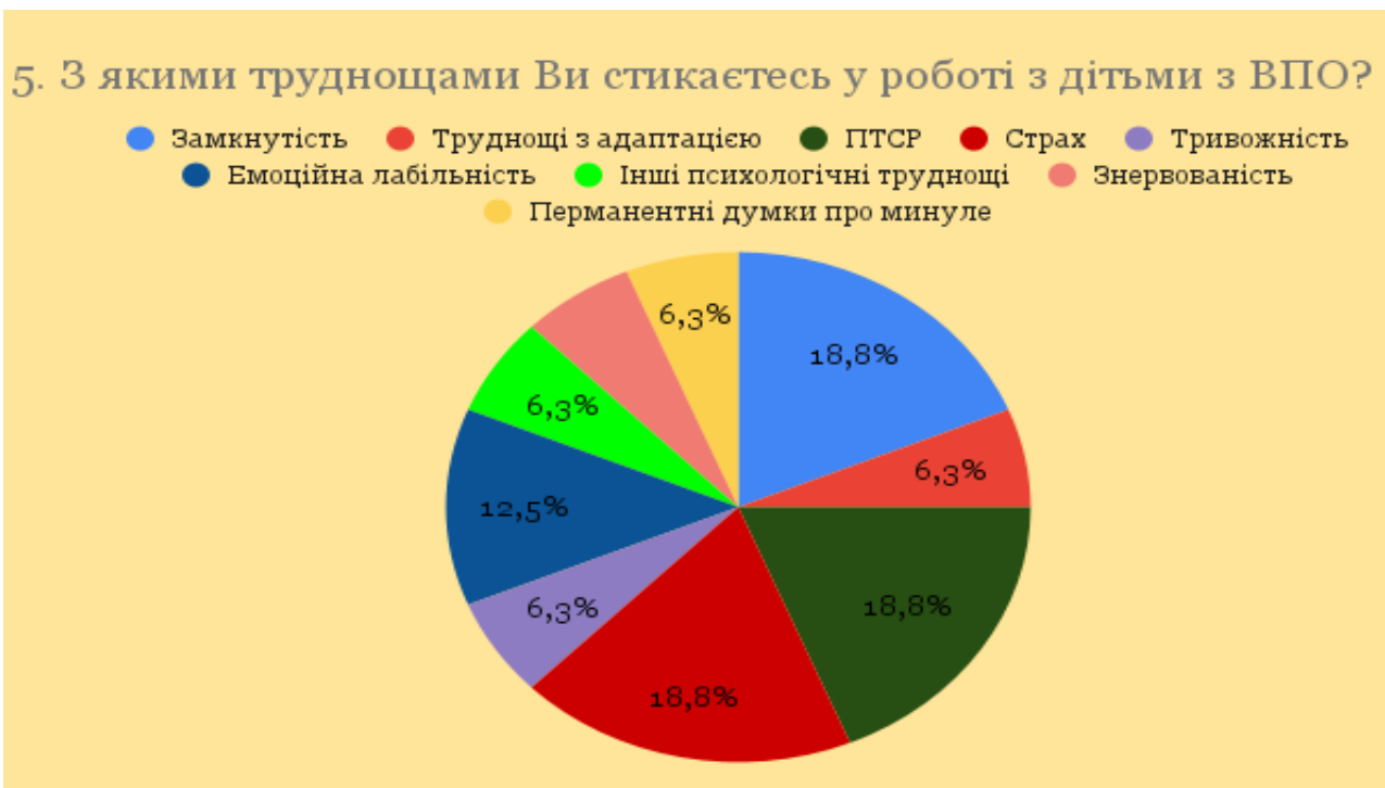
Рис. 2.2. Результати опитування респондентів на питання «З якими труднощами Ви стикаєтесь у роботі з дітьми ВПО?»

Шосте питання стосувалося особливостей в роботі з дітьми ВПО в порівнянні з іншими категоріями дітей. Можна виокремити такі особливості: