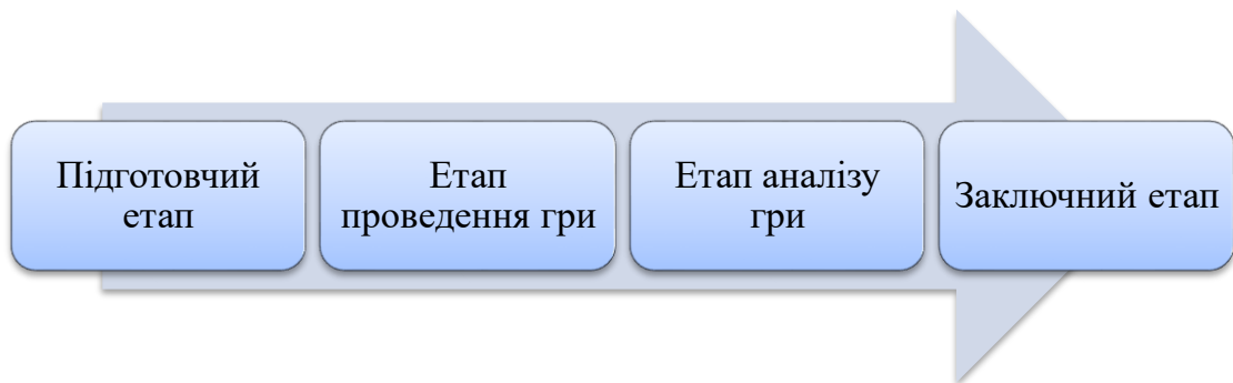
Рис. 1.2. Етапи реалізації ігрової технології в діяльності соціального працівника

Технологічність використання ігор в діяльності соціального працівника вимагає ретельної підготовки до організації та проведення ігор за такими етапами (Рис. 1.2):