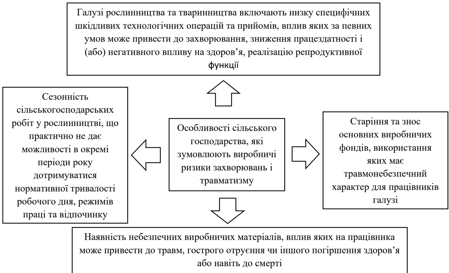
Рис. 4.1 Система основних особливостей сільського господарства, які зумовлюють виробничі ризики травматизму і захворювань персоналу