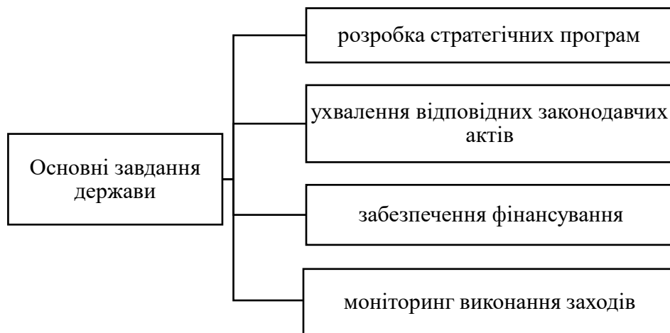
Рис 3.1 Основні завдання держави у процесі відновлення земельних ресурсів