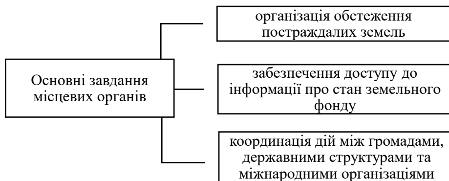
Рис 3.2 Основні завдання місцевих органів у процесі відновлення земельного фонду та землекористування

Місцеві органи влади є важливою ланкою у реалізації програм відновлення земельного фонду та землекористування (рис.3.2). Вони виступають безпосередніми виконавцями національної стратегії, адаптуючи її до конкретних умов регіону.