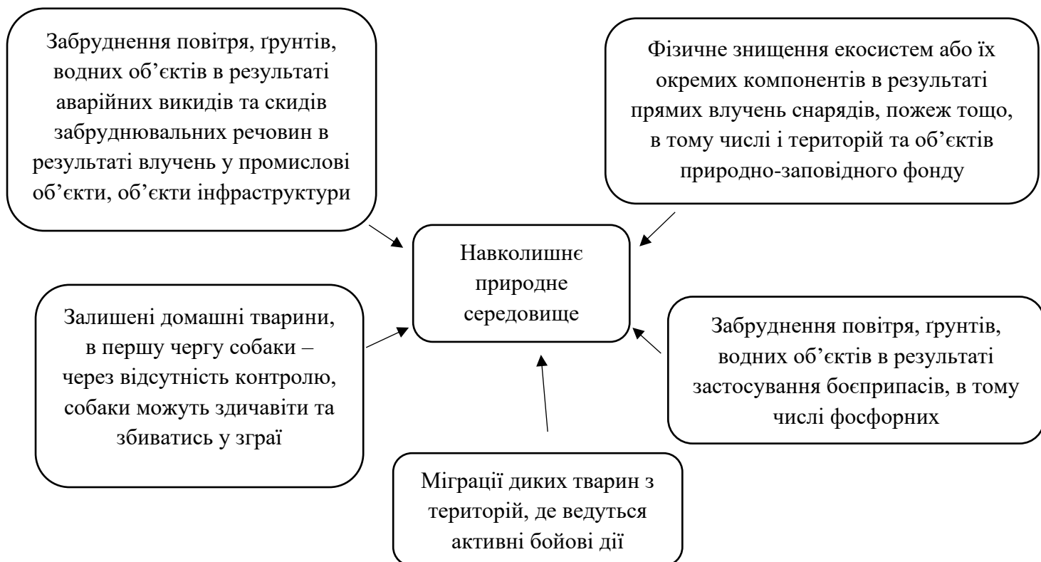
Рис. 2.1 Чинники, що впливають на стан природних екосистем

Воєнний стан, спричинений повномасштабною агресією проти України, кардинально змінив систему землекористування країни, поставивши її перед безпрецедентними викликами. Земельний фонд, що є одним із головних ресурсів держави, зазнав значних змін, пов'язаних із замінуванням територій, руйнуванням інфраструктури, забрудненням ґрунтів і зміною економічних умов використання земель. Окрім цього, порушення земельних відносин, соціально-демографічні зрушення та екологічні наслідки бойових дій створюють додаткові проблеми, які потребують комплексного вирішення (рис.2.3).