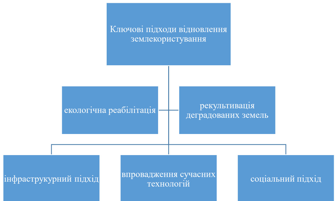
Рис.1.2 Ключові підходи у процесі відновлення землекористування

ключових підходів є екологічна реабілітація, яка включає усунення наслідків забруднення ґрунтів, відновлення їхньої родючості та боротьбу з ерозією (рис. 1.2). Під час війни значна частина земель могла бути забруднена важкими металами, хімічними речовинами або токсичними залишками від вибухів. У таких випадках необхідно проводити глибокий аналіз складу ґрунту, використовувати спеціальні методи очищення та впроваджувати технології біоремедіації, які дозволяють відновити природний баланс ґрунтів [51, ст. 74].