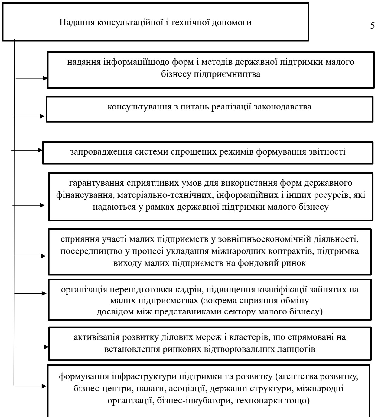
Рис. 3.2. Інструменти впливу на малий бізнес консультування й технічної підтримки з боку держави [розроблено автором]

Держава може також використовувати форму підтримки у сфері інновацій, науки і промислового виробництва. Зокрема, допомогати у створенні бізнес-інкубаторів, інноваційних бізнес-інкубаторів, науково-технологічних центрів, центрів трансферу технологій. Держава може сприяти розвитку венчурного підприємництва, створювати систему економічних стимулів для розвитку економіки на основі технологічних інновацій. Важливими інструментами впливу держави на розвиток малого бізнесу є