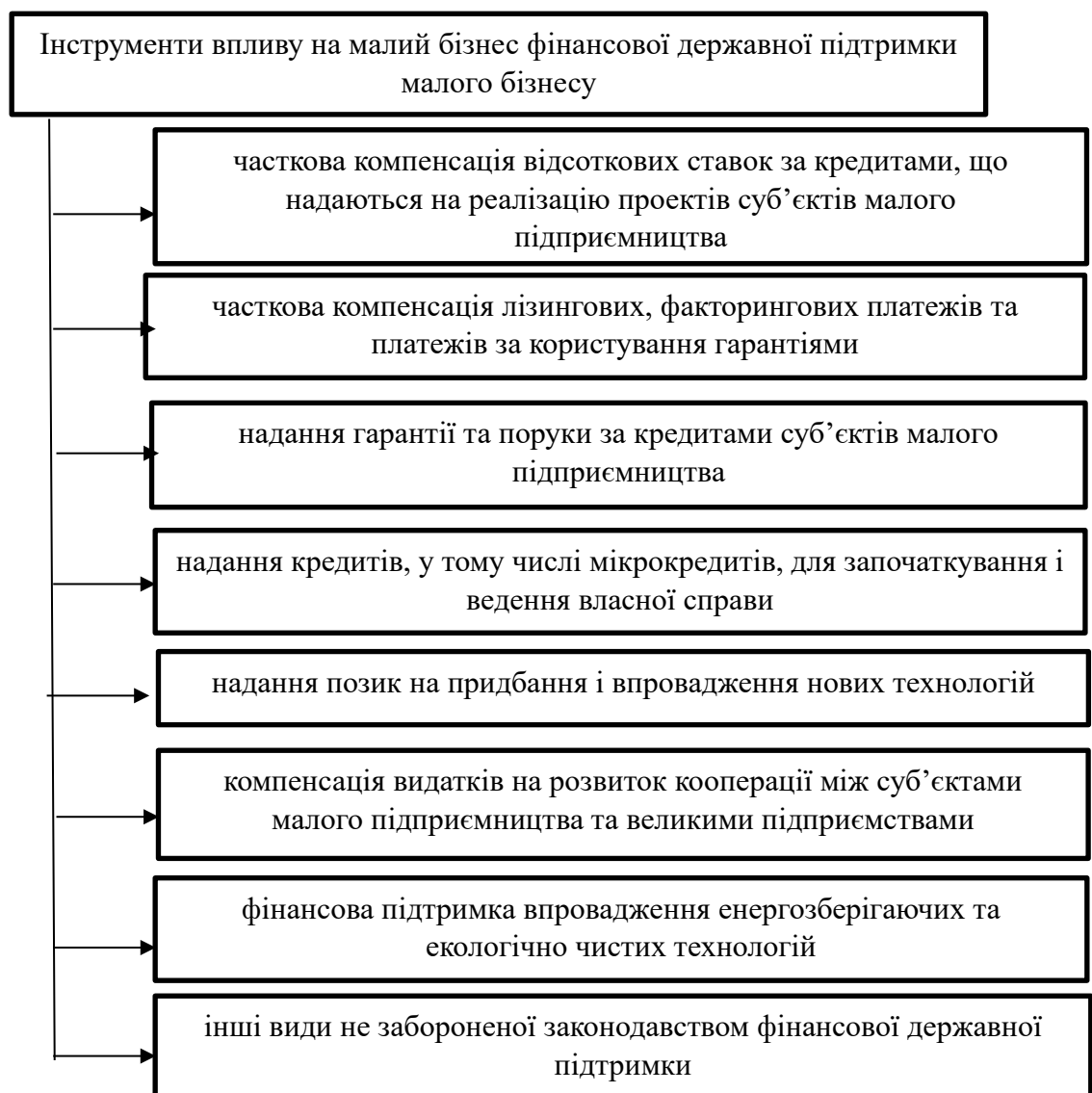
Рис. 3.1. Інструменти впливу на малий бізнес фінансової державної підтримки малого бізнесу [розроблено автором]

Державна підтримка розвитку малого бізнесу може здійснюватися у різних формах. Ключовими формами такої підтримки є фінансова державна підтримка малого бізнесу (рис. 3.1.) та консультування й технічна підтримка (рис. 3.2.), кожна з цих форм має свої інструменти впливу на малий бізнес.