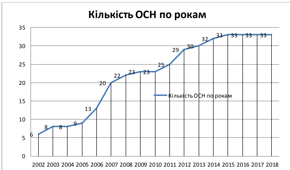
Рис. 1. Динаміка розвитку ОСН в м. Миколаєві (легалізованих ОСН).

У підрозділі 2.3. «Оцінка ефективності діяльності ОСН в українських містах» проаналізована динаміка розвитку ОСН в м. Миколаєві (рис. 1)