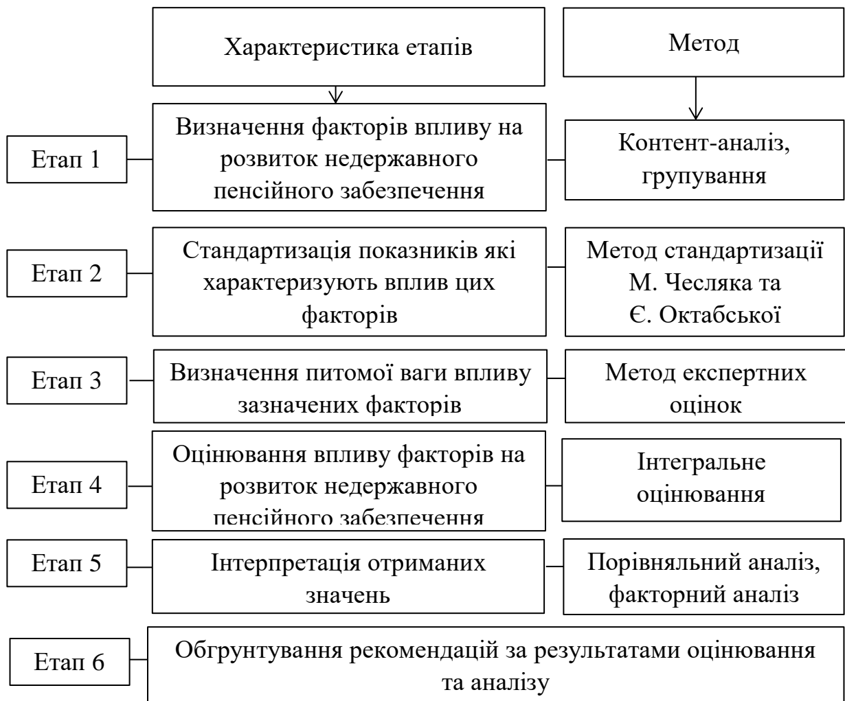
Рис. 1. Етапи оцінювання факторів, які впливають на розвиток недержавного пенсійного забезпечення

Allianz на основі трьох груп показників: демографічних; показників, які характеризують державні фінанси та параметри пенсійних систем, а також Глобальний пенсійний індекс Мельбурн Мерсер в якому беруться до уваги понад 40 показників для визначення адекватності, стійкості та цілісності пенсійної системи тої чи іншої країни. Можна констатувати, що переважна більшість досліджень стосується оцінювання пенсійних систем вцілому, проте практично відсутні дослідження пов'язані з визначенням впливу факторів на розвиток недержавного пенсійного забезпечення. Аналіз літератури з проблематики інтегрального оцінювання дозволив сформулювати схему побудови інтегрального показника впливу фінансово-економічних, соціальних та інституційних факторів на розвиток НПЗ (рис. 1).