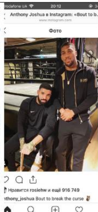
Фото з інстаграму Ентоні Джошуа (праворуч), на фото боксер разом з репером Дрейком (ліворуч).

існує. Ще у березні, боксер Ентоні Джошуа розмістив фото з репером і написав: «Готовий зруйнувати прокляття, і... він програв свій бій!»