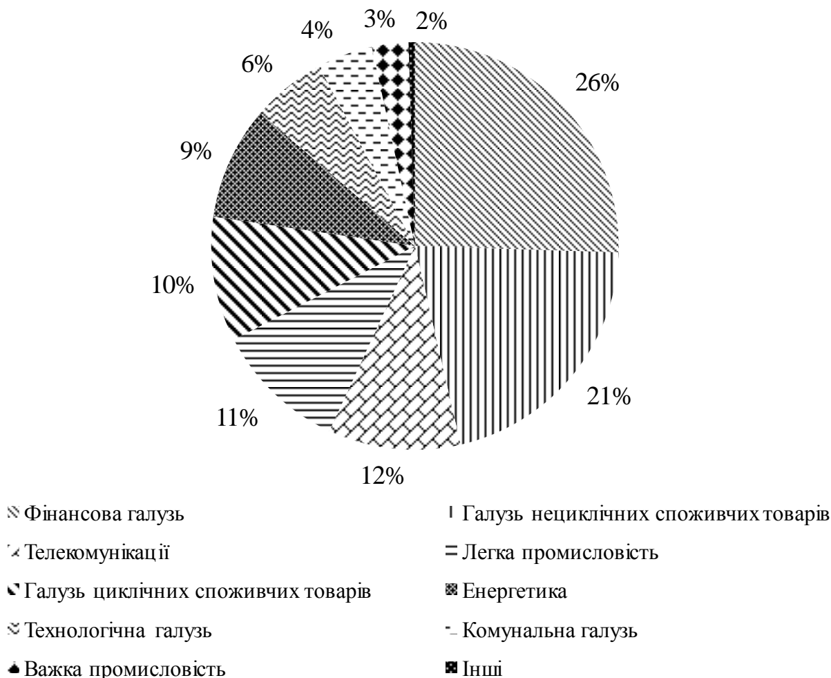
Рис. 1. Галузева структура світового ринку М&А-угод в 2017 р.

Іноземні компанії використовують угоди зі злиття та поглинання не лише для посилення конкурентних переваг, але і як інструмент перерозподілу власності за допомогою рейдерства як специфічної форми ворожих поглинань, обумовлених нестабільністю приватної власності та нерозвиненістю корпоративного права.