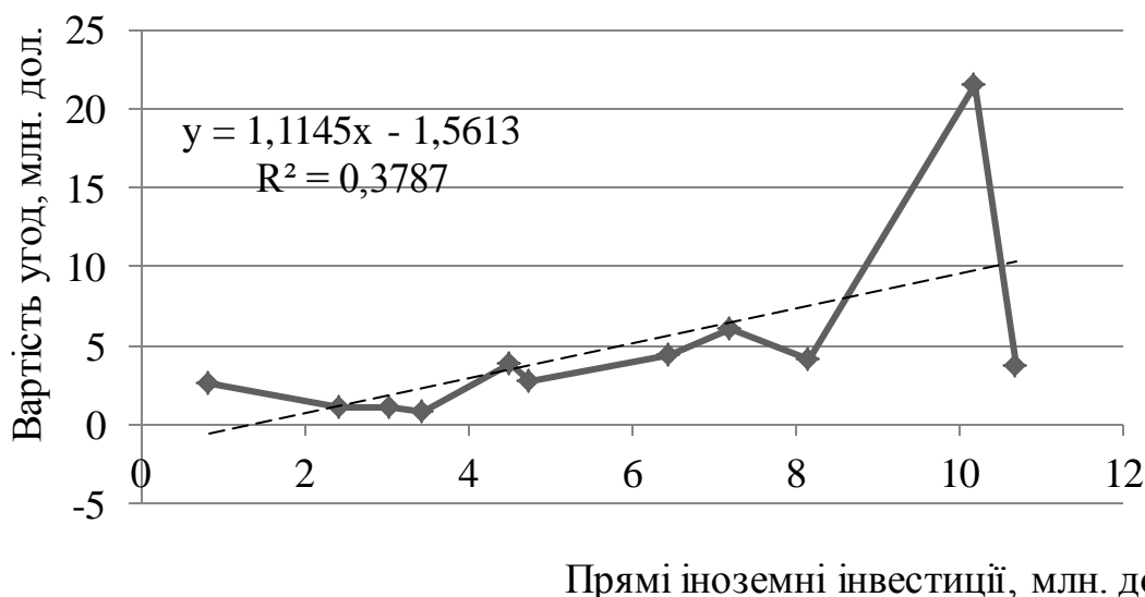
Рис. 2 Залежність вартості М&А-угод від прямих іноземних інвестицій в Україні.

Досліджено, що існує середній прямий зв'язок між вартістю М&А-угод та прямими іноземними інвестиціями. Вплив прямих іноземних інвестицій на динаміку угод складає 37,87%; частка інших факторів – 62,13% (рис.2).