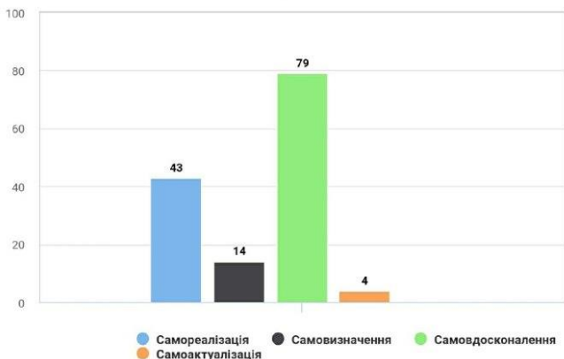
Рис. 1. Кількість цілей, спрямованих на саморозвиток

Низькі показники за фактором інтернальності свідчать про небажання брати на себе відповідальність за свої вчинки. А також ми виявили залежність, що чим більші показники по фактору інтернальності, тим вони будуть більші і по фактору